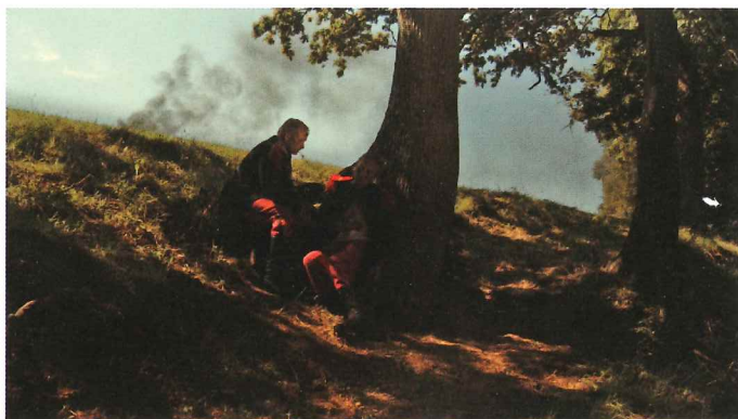
«Wunderhorn» de Clara Pons

qui existent à ce jour uniquement dans leur version originale avec piano.