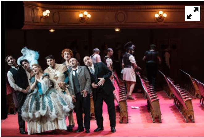
Viva la mamma ! à l'Opéra des Nations (Genève)

À Genève, rien ne va plus dans le petit monde de l'opéra : le ténor refuse de chanter, la prima donna tente de monopoliser la scène, le contre-ténor discute âprement des modifications à apporter à l'affiche... Face aux démissions successives, l'impresario n'a pas d'autre choix que de recruter des remplaçants au talent plus que discutable. Et le public de subir les roucoulades de Mamma Agata, véritable éléphant lyrique dans le magasin de porcelaine qu'est un opéra.